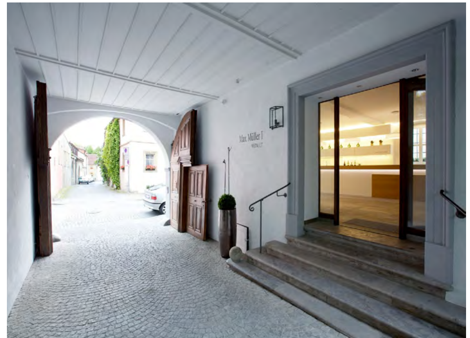
Hofdurchfahrt und Eingang