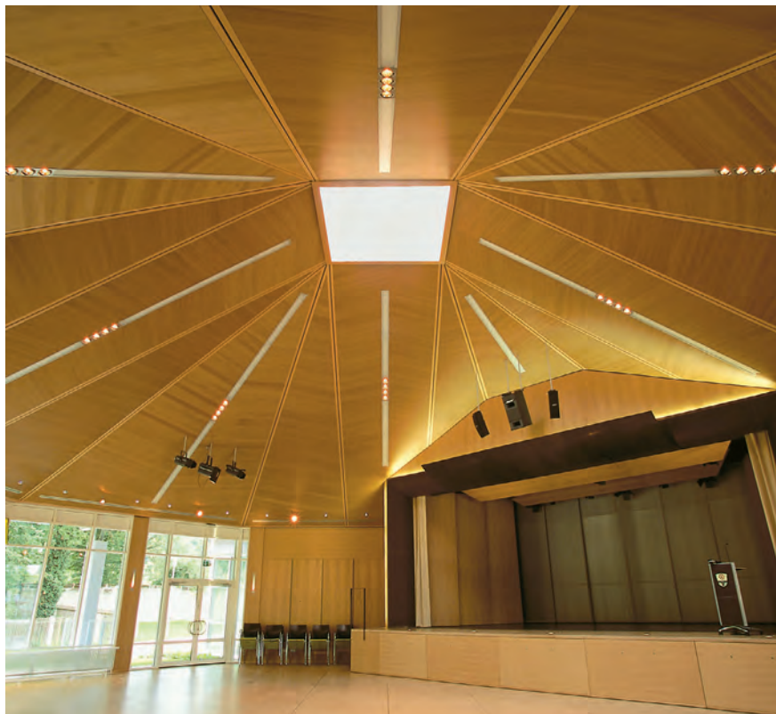
Bürgerhaus Schwarzenbruck TOPAKUSTIK Deckenverkleidung Eiche lackiert