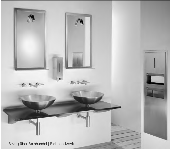
Bezug über Fachhandel | Fachhandwerk