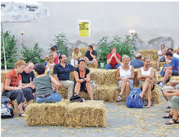
Foto oben: Modellprojekt Fürstentfeldbruck Foto Mitte: Planen in Nachbarschaften. Der Planungsprozess mit den Eigentümern bestimmt die Planungsmethodik