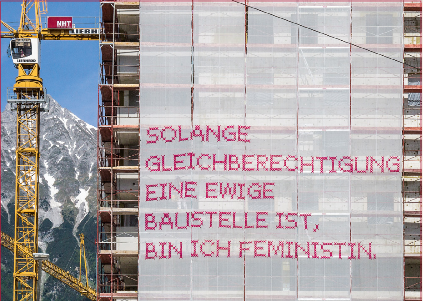
SOLANGE bespielt weltweit Baustellen mit temporären Kunstwerken und setzt sich für die Gleichstellung der Geschlechter in allen Bereichen ein. www.solange-theproject.com @solange_theproject — Foto: Katharina Cibulka, SOLANGE #3, Innsbruck, 2018