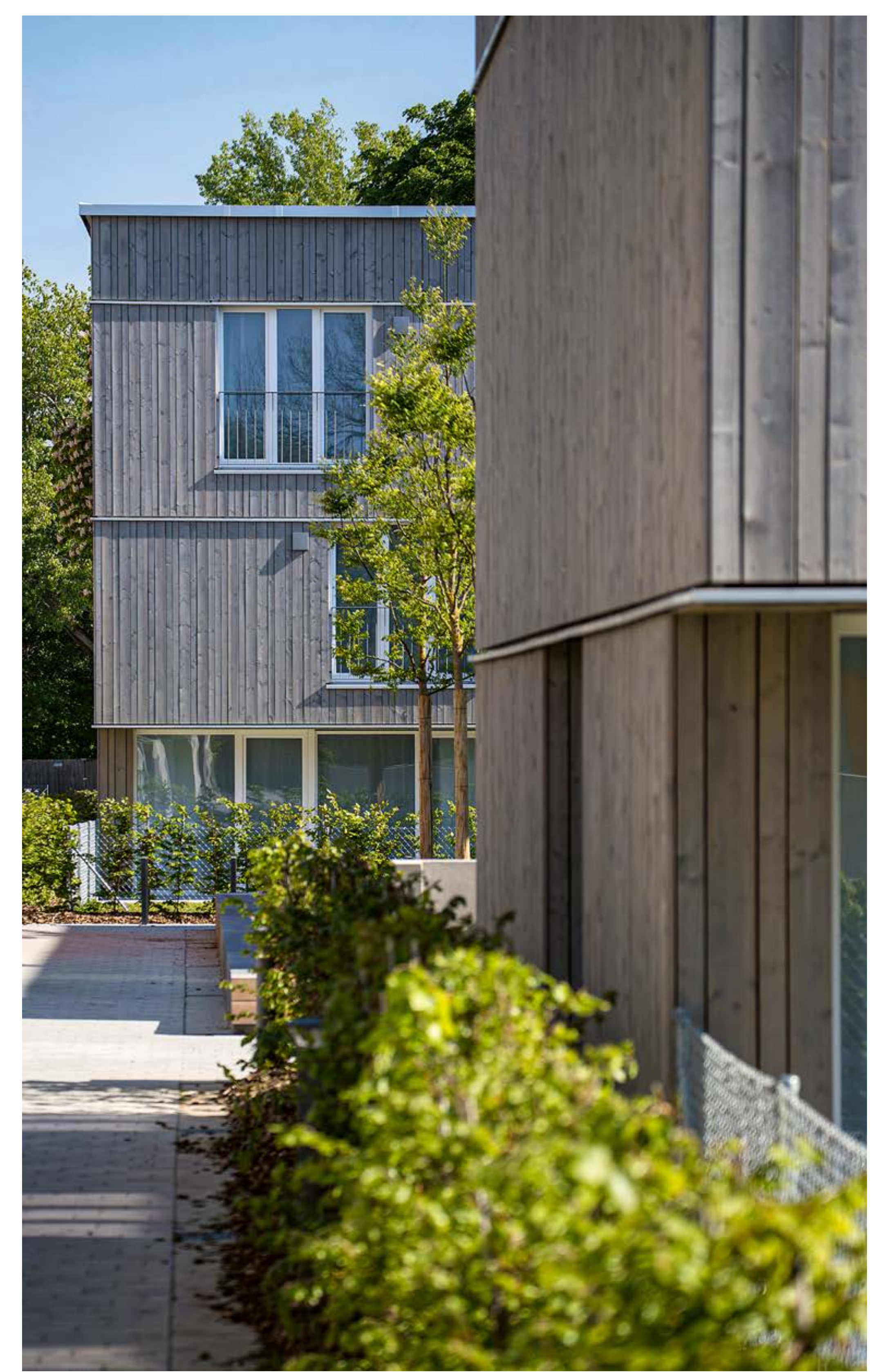
Grundrissausschnitt EG | © dressler mayerhofer rössler architekten Zugangssituation | © Florian Braun