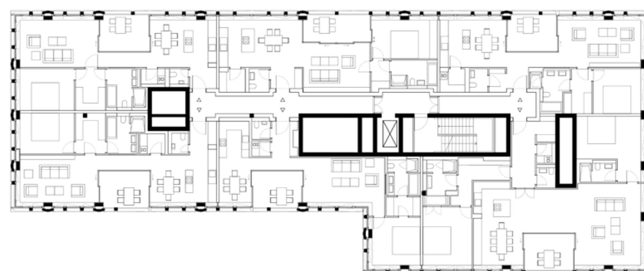
Grundriss 4. OG | © Hild und K Architekten