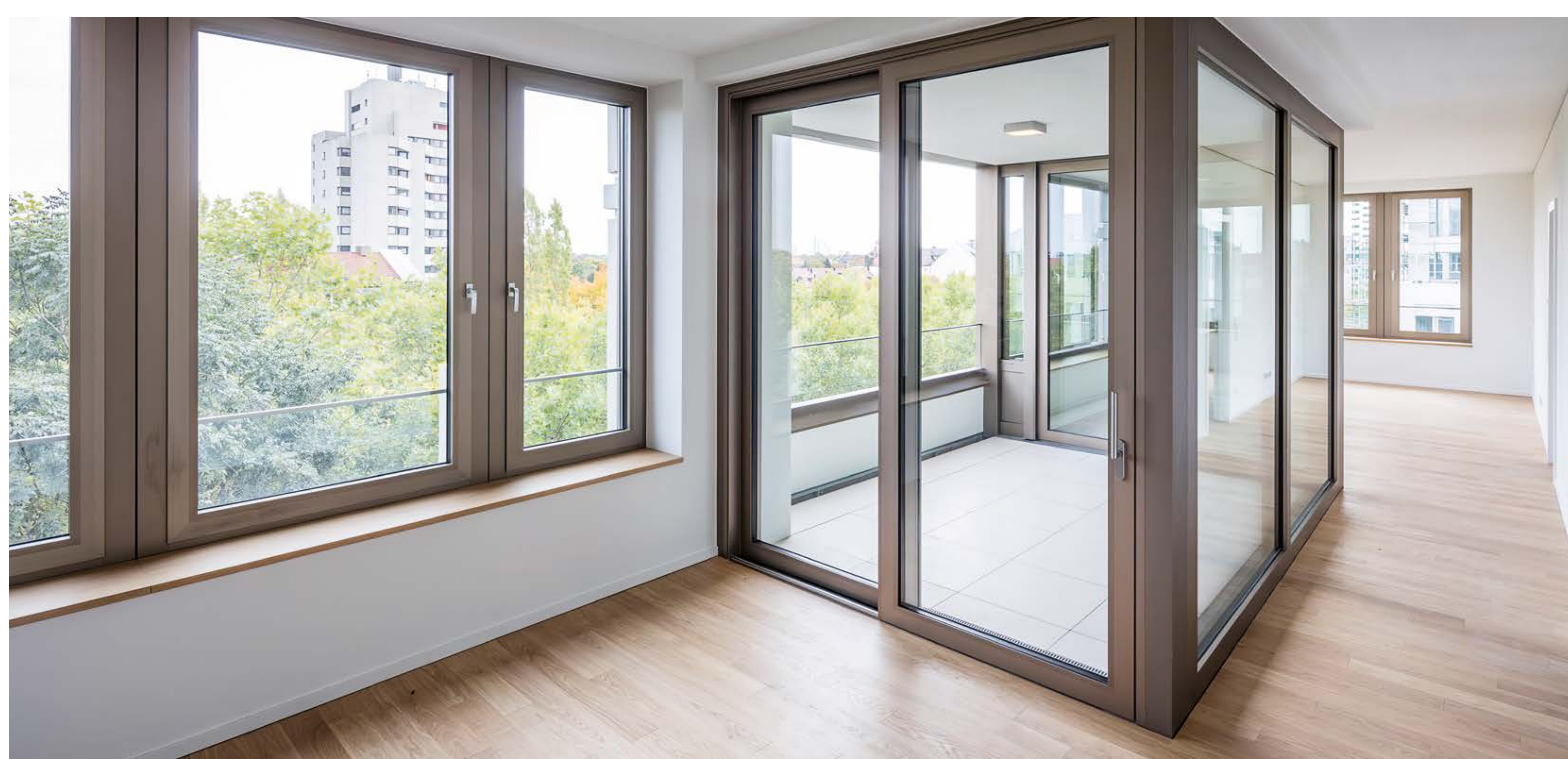
Wohnung mit eingezogener Loggia