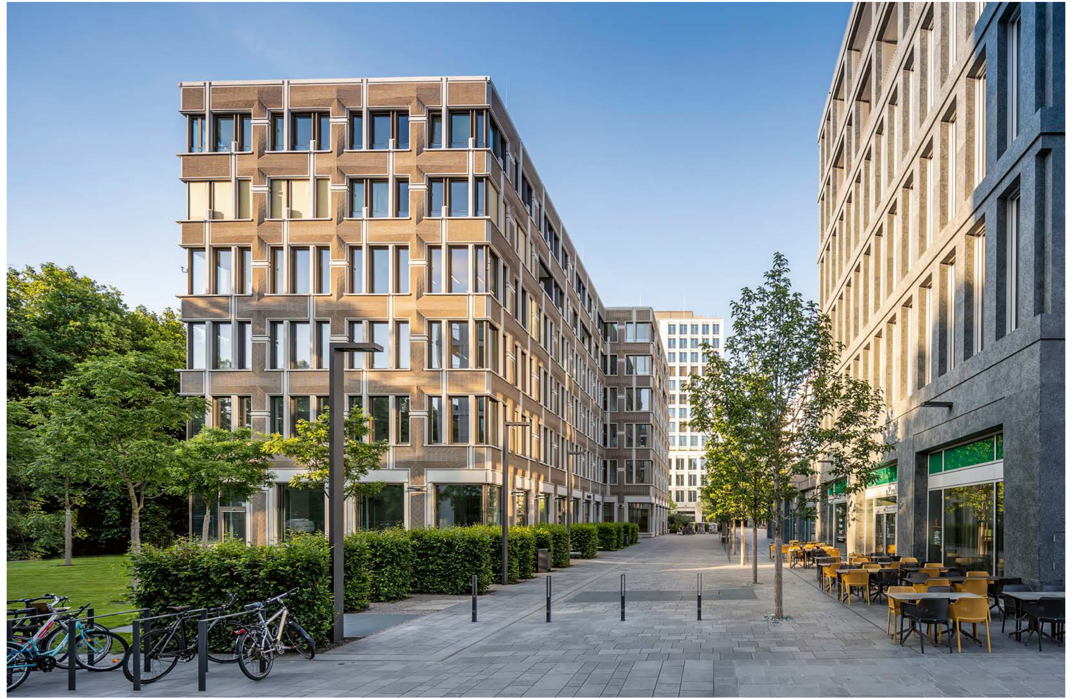
Ansicht Nord