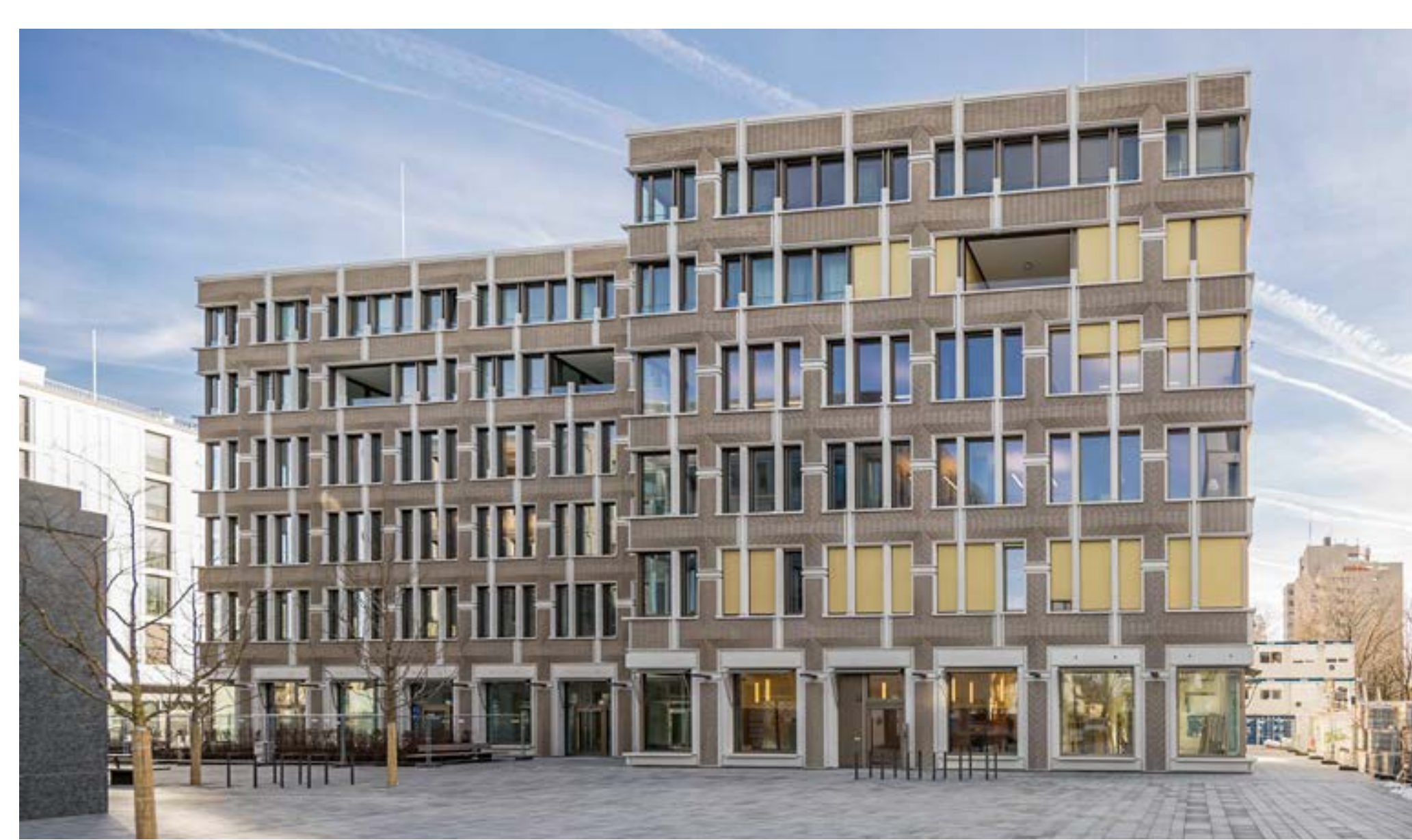
Ansicht West