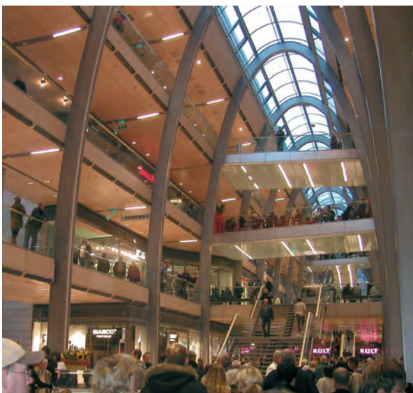
↑ Die neue „Europa Passage Hamburg“ von BRT Architekten

So geht's also auch: ein Einkaufszentrum, das fliegende Händler, Kaufhäuser, Discounter, mittelständische Läden und sogar Wohnen miteinander verbindet. Im niederländischen Enschede ist den Planern dies, wie Klaus Dieter Weiss, der Moderator des Dezember-Architekturclubs, berichtete, aufs Beste gelungen. Kurz: ein Beispiel, bei dem ganz einfach die Struktur stimmt. Wie anders sieht es da jedoch meist in Deutschland aus... Konsummeilen, die sich alle erschreckend ähneln und zudem stadtplanerisch gesehen meist am falschen Standort liegen, zerstören gewachsene Strukturen.