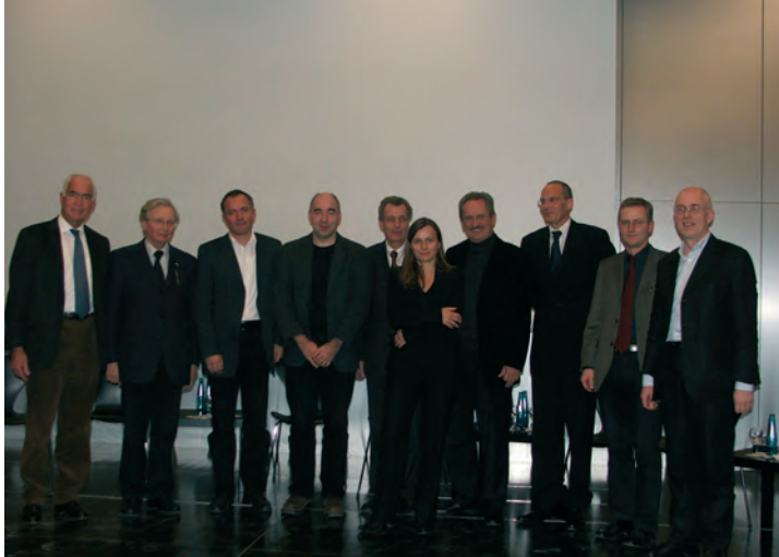
↑ Die Referenten der Fachtagung

land wie ein Schreckgespenst. Doch auch hierzulande gibt es schon gelungene Konzepte gemeindlicher Mischnutzung, Umnutzungen sozio-kultureller Art, aber auch Rückbaumaßnahmen, deren Raumprogramm sich an geschrumpften Gemeindegroßen orientiert. Abtretung oder aber Übergabe leerer Gotteshäuser an andere (auch monotheistische) Religionsgemeinschaften scheinen die katholische und evangelische Kirche bisher aber kategorisch auszuschließen.