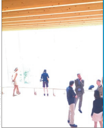
Eines der prämierten Fotos der letztjährigen Wettbewerbs „Ich sehe was, was Du nicht siehst“

Abgabemodus: Maximal drei Aufnahmen (tif, jpg), schwarz-weiß oder farbig; Größe ca. 1 MB; Einsendeschluss 1. Juli 2016. Bitte Postadresse und Alter angeben sowie das Gebäude oder die Freianlage, das/die am Architektouren-Wochenende besucht wurde. Viel Erfolg!