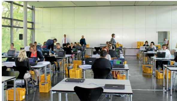
Auszählt is: Die Ergebnisse der Kammerwahlen 2016 finden Sie in diesem Heft.